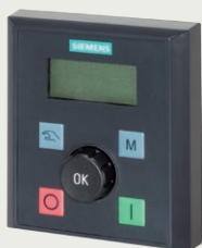
V20 BOP (basisbedieningspaneel)