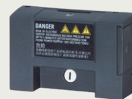
V20 Parameter Loader