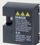
V20 BOP Interface