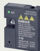
V20 Smart Access